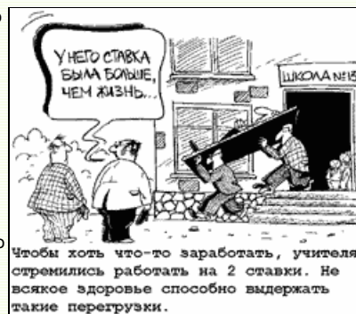
Чтобы хоть что-то заработать, учителя стремились работать на 2 ставки. Не всякое здоровье способно выдержать такие перегрузки.