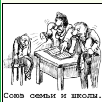
Союз семьи и школы.

Советские руководители панически боялись малейшего инакомыслия . Зародившись, к примеру, в области политически нейтральной математики, оно могло проникнуть в сферу гуманитарных дисциплин. Здесь его присутствие было недопустимо и преступно. За воспитание критически мыслящих мудрецов советская власть жаловала "сумой да тюрьмой". Спасая карьеры, просвещенческие администраторы на корню уничтожали малейшие намёки на самостоятельное мышление и все его возможные источники.